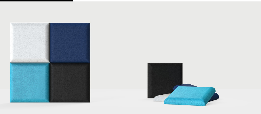
Vážený součinitel zvukové pohltivosti ( \alpha_w )